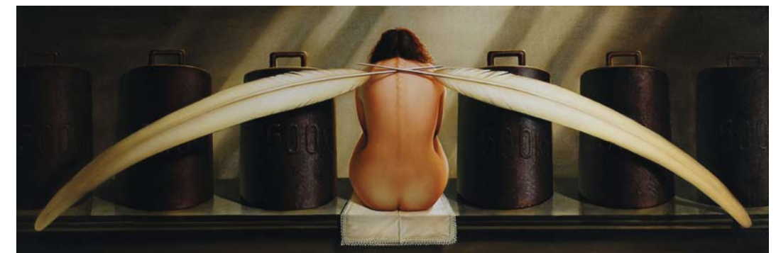
Siegfried Zademack „Die Zähmung der Schwerkraft“

Wir bitten Sie um Anmeldung auf beiliegender Rückantwort oder per Mail events@kastner.de bis zum 18. Juni 2018.