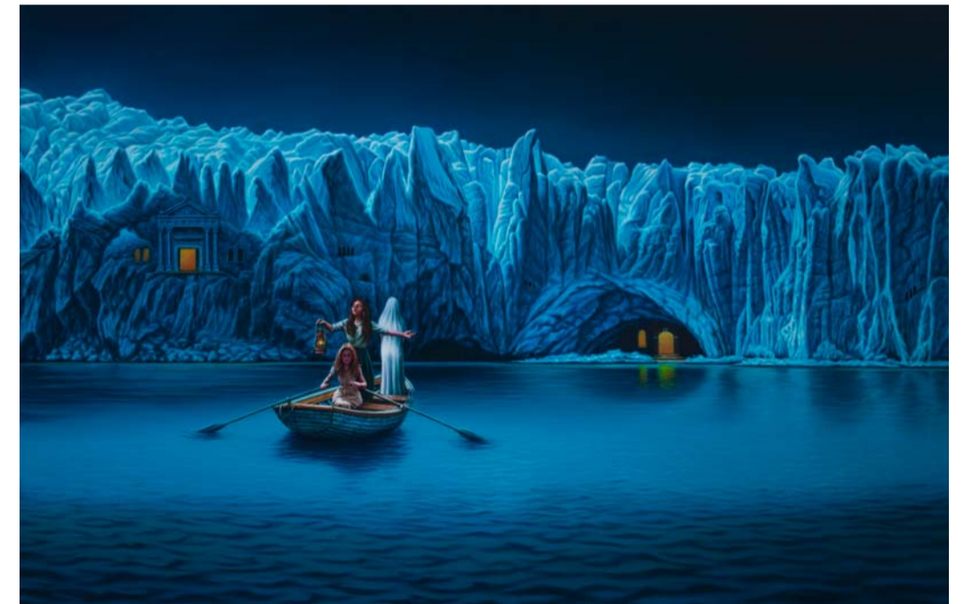
Roland Heyder „Glashaus“