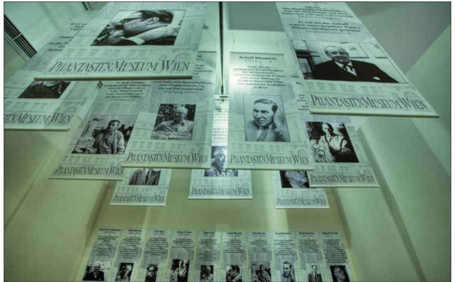
Die Impulsgeber sind auf Fahnen – gleich beim Museumseingang – zu sehen.