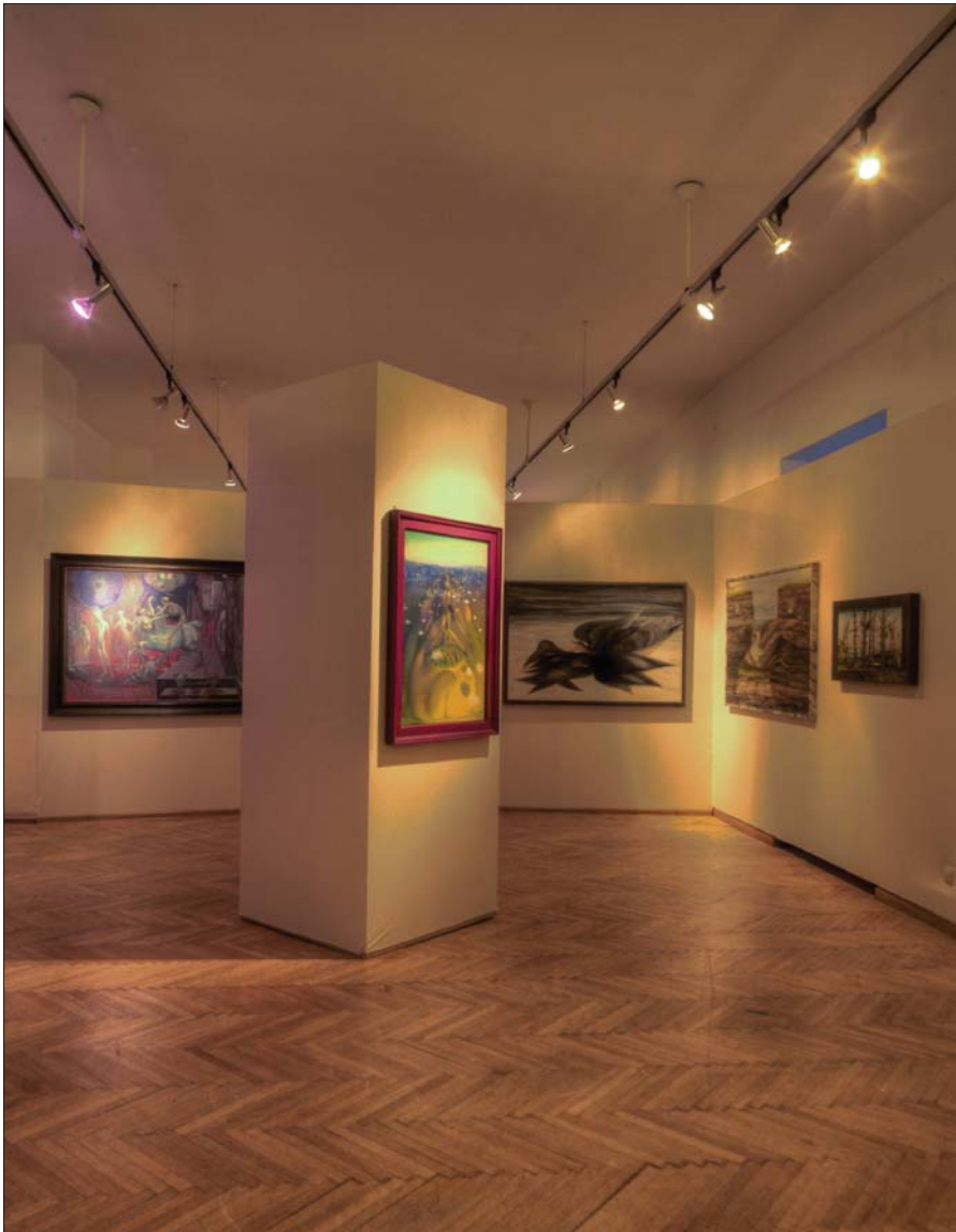
Dieses Bild zeigt Werke von Ernst Fuchs, Rudolf Hausner und Anton Lehmden.